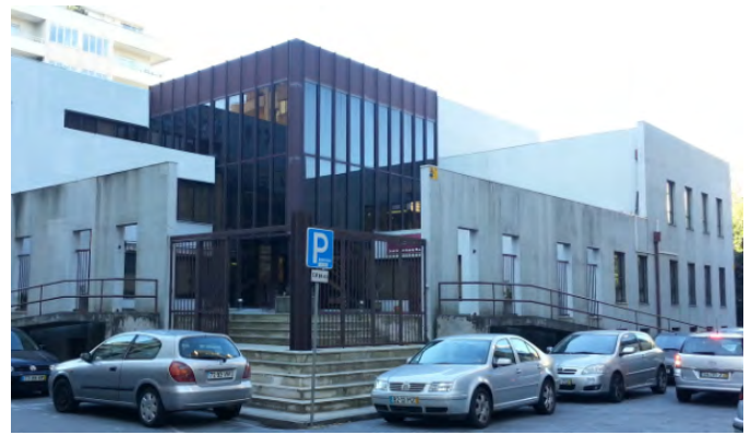
Atuais instalações do CAS BRAGA

De dezembro de 1991 a 1995, a delegação de Braga dos SSFA passou a ocupar parte das instalações do então Centro de Recrutamento de Braga- Prédio Militar 19 (PM 19).