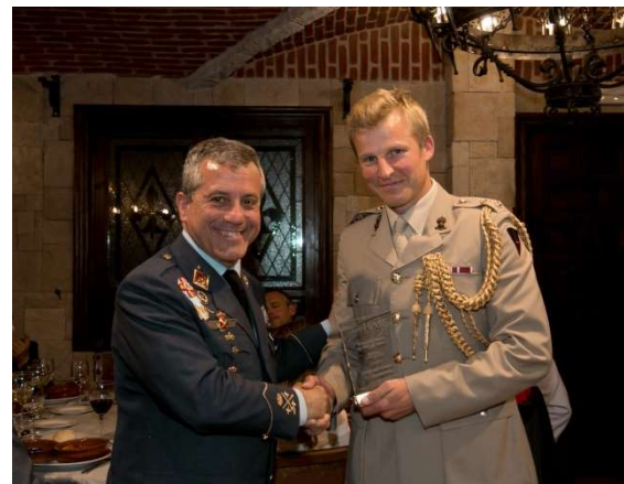
La cérémonie officielle de 2018 à Tolède, Espagne